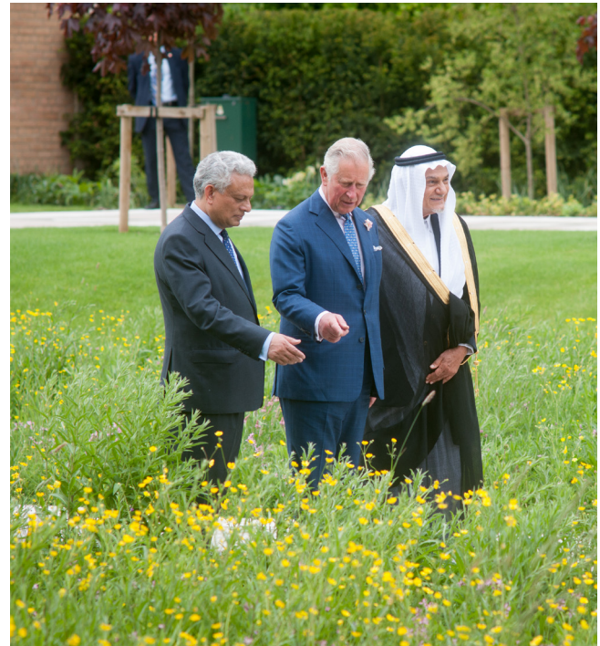
جلالة الملك تشارلز الثالث، وصاحب السمو الملكي الأمير تركي الفيصل، ومدير المركز الدكتور فرحان نظامي

ولطالما كان دعم جلالته المستمرّ دافعاً قوياً للمركز في تحقيق طموحاته، حيث جذب هذا الدعم اهتماماً عالمياً وأتاح للمركز توسيع نطاق أعماله وتعزيز شراكاته الدولية. واليوم، يواصل المركز مسيرته مستنداً إلى هذا الإرث من الدعم القيم الراسخ، ساعياً إلى تعميق إنتاجه الأكاديمي وتوسيع أثره العالمي من خلال مبادرات جديدة تعالج القضايا المعاصرة وتغرس قيم الاحترام المتبادل بين الثقافات، وتعزّز الإبداع الفكري والعلمي في مجالات متعددة تشمل القيم الإنسانية والتنمية المستدامة.