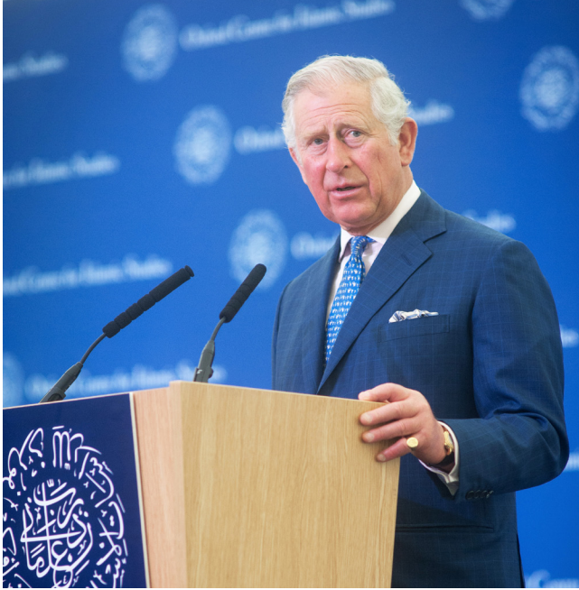
صاحب الجلالة الملك تشارلز الثالث

بأسمى معاني الفخر والاعتزاز، يُعلن مركز أوكسفورد للدراسات الإسلامية أن جلالة الملك تشارلز الثالث قد تفضّل بالموافقة على الاستمرار في رعايته الفخرية السامية للمركز. إن هذا التكريم يعكس عمق ارتباط جلالته برسالة المركز ومقاصده العالية، ويؤكد التزامه الراسخ بدعم الجهود الفكرية التي تعزّز الحوار بين الثقافات. فمنذ أن شرف جلالته المركز بقبوله الرعاية الفخرية في عام ١٩٩٣م، ظلّ دعمه المستمرّ حجر الزاوية في مسيرة نموّ المركز وارتقائه إلى مصافّ المؤسسات الرائدة في دراسة الثقافة والحضارة الإسلامية بمختلف أبعادها.