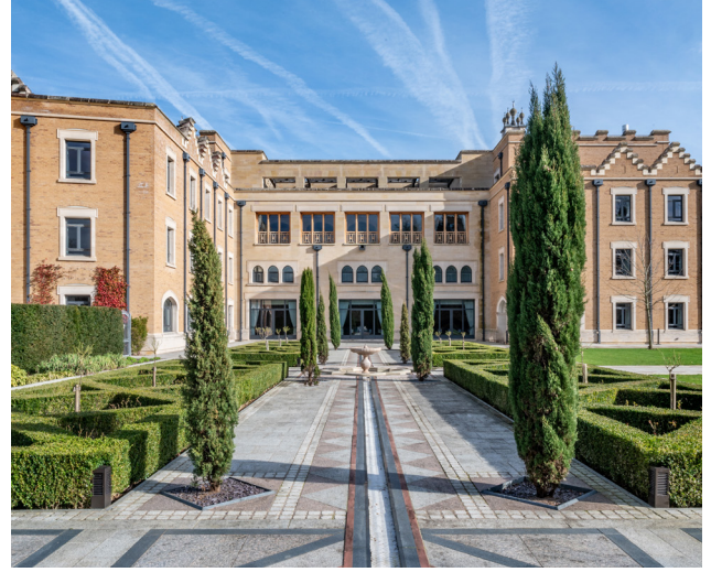
حديقة الملك تشارلز الثالث، المعروفة سابقًا باسم حديقة أمير ويلز

وقد أثنى جلالته، خلال زيارته المتكررة وتصريحاته العامة، على جهود المركز في تعزيز التفاهم الثقافي والحوار المثمر بين الحضارات، وأشاد بالدور الريادي الذي يلعبه في تقديم صورة مشرقة عن القيم الإنسانية الإسلامية. وفي لفظة رمزية تحتفي بهذه المناسبة، أعيدت تسمية حديقة المركز، التي ساهم جلالته في تصميمها، لتصبح حديقة جلالة الملك تشارلز الثالث، كما حظيت زمالة أمير ويلز بالمركز بإعادة تسميتها لتصبح زمالة الملك تشارلز الثالث.